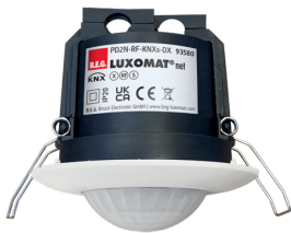
PD2N-RF-KNXs-DX-FC Nr art.: 93580

Aby otrzymać zestaw zgodnie ze specyfikacją techniczną, proszę zamówić wymienione produkty.