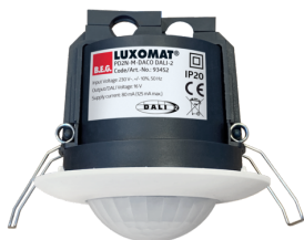
PD2N-M-DACO DALI-2 Nr art.: 93452

Aby otrzymać zestaw zgodnie ze specyfikacją techniczną, proszę zamówić wymienione produkty.