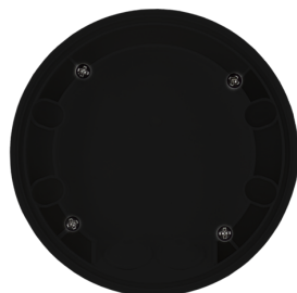
Adapter do montażu natynkowego IP54 PD2N- / PD4N-FM (podtynkowe) Nr art.: 93753

Napięcie: Do łączenia z systemami DALI Bus, maks. 22.5 V DC Wymiary: Ø 106 x 42 mm Ustawienia: poprzez magistralę DALI i aplikację obsługującą multisensory DALI zgodnie z normą IEC62386, cz. 101, 103, 303 i 304