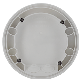
Adapter do montażu natynkowego IP54 PD2N- / PD4N-FM (podtynkowe) Nr art.: 93752

Napięcie: Do łączenia z systemami DALI Bus, maks. 22.5 V DC Wymiary: Ø 106 x 42 mm Ustawienia: poprzez magistralę DALI i aplikację obsługującą multisensory DALI zgodnie z normą IEC62386, cz. 101, 103, 303 i 304