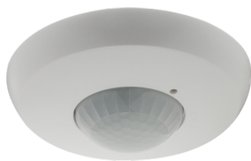
PD2N-BMS-FM (podtynkowe) DALI-2 Nr art.: 93544

Aby otrzymać zestaw zgodnie ze specyfikacją techniczną, proszę zamówić wymienione produkty.