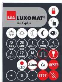
IR-LC-plus Nr art.: 92095

Wymiary: 40 x 55 x 103 mm Kolor materiału: czarny Częstotliwość: 2.4 GHz pasmo ISM, GFSK 0.2 dBm + 5.3 dBi = 5.5 dBm