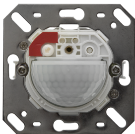
Indoor 180-S bez ramki Nr art.: 92660

Aby otrzymać zestaw zgodnie ze specyfikacją techniczną, proszę zamówić wymienione produkty.