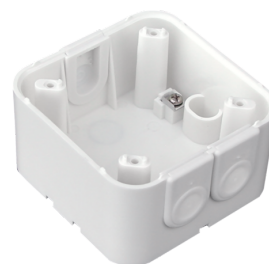
Adapter do wersji SM Indoor 180 Nr art.: 92141

Wymiary: 86 x 86 mm Stopień / Klasa ochrony: IP20 Obudowa: poliwęglan, odporny na promieniowanie UV