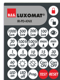
IR-PD-KNX Art.nr.: 92123

Afmetingen: 47 x 19 x 10 mm Beschermingsgraad/-klasse: IP20 Omgevingstemperatuur: -20 °C tot +40 °C