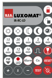
IR-RC-LD Art.nr.: 92649

Batterij: 3.0 V Lithium CR2032 (inclusief) Afmetingen: 80 x 60 x 8 mm Kleur: -