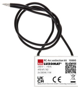
Overspanningsbegrenzer Art.nr.: 10880

Spanning: 230 V AC \pm 10\% Afmetingen: 38 x 12 x 26 mm Beschermingsgraad/-klasse: IP20 / Klasse II