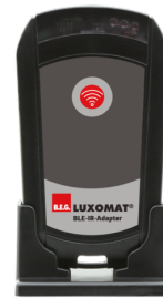
BLE-IR-Adapter Art.nr.: 93067

Spanning: 230 V AC \pm 10\% Afmetingen: 50 x 23 x 8 mm Beschermingsgraad/-klasse: IP20 / Klasse II