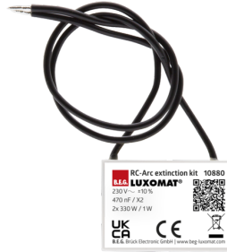
Overspanningsbegrenzer Art.nr.: 10880

Batterij: 3.0 V Lithium CR2032 (inclusief) Afmetingen: 80 x 60 x 8 mm Kleur: -