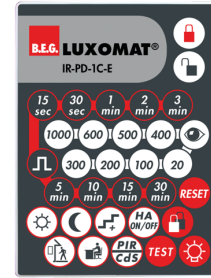
IR-PD-1C-E Art.nr.: 92077

Spanning: 230 V AC \pm 10\% Afmetingen: 38 x 12 x 26 mm Beschermingsgraad/-klasse: IP20 / Klasse II