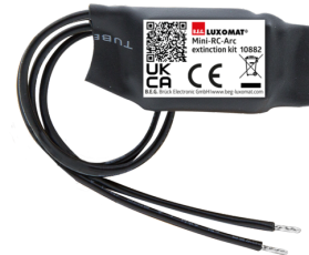
Mini-Overspanningsbegrenzer Art.nr.: 10882

Batterij: 3.0 V Lithium CR2032 (inclusief) Afmetingen: 80 x 60 x 8 mm Kleur: -