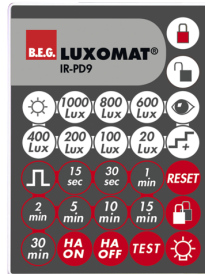
IR-PD9 Art.nr.: 92201

Afmetingen: 40 x 55 x 103 mm Kleur: zwart Frequentie: 2.4 GHz ISM band, GFSK 0.2 dBm + 5.3 dBi = 5.5 dBm