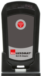
BLE-IR-Adapter Art.nr.: 93067

Afmetingen: Ø 36 mm Behuizing: UV- bestendig polycarbonaat Kleur: zilver glanzend