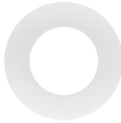
Afdekring PD9 Ø 36 mm Art.nr.: 92238

Afmetingen: Ø 36 mm Behuizing: UV- bestendig polycarbonaat Kleur: antraciet glanzend