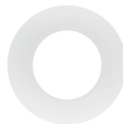
Afdekring PD9 Ø 36 mm Art.nr.: 92238

Beschermingsgraad/-klasse: IP65 Behuizing: UV- bestendig Kleur: transparant