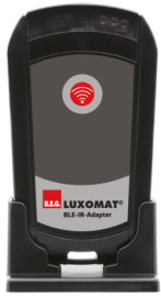
BLE-IR-Adapter Art.nr.: 93067

Afmetingen: 40 x 55 x 103 mm Kleur: zwart Frequentie: 2.4 GHz ISM band, GFSK 0.2 dBm + 5.3 dBi = 5.5 dBm