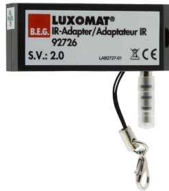
IR adapter voor Smartphones Art.nr.: 92726

Afmetingen: 40 x 55 x 103 mm Kleur: zwart Frequentie: 2.4 GHz ISM band, GFSK 0.2 dBm + 5.3 dBi = 5.5 dBm