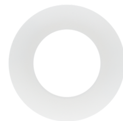
Afdekring PD9 Ø 36 mm Art.nr.: 92238

Afmetingen: Ø 36 mm Behuizing: UV- bestendig polycarbonaat Kleur: antraciet glanzend