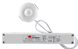
PD9-1C-IB Art.nr.: 92902

Om de bundel volgens de technische specificatie te ontvangen, bestelt u de genoemde items.