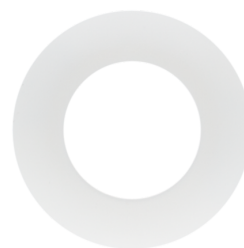
Afdekring PD9 Ø 36 mm Art.nr.: 92238

Beschermingsgraad/-klasse: IP65 Behuizing: UV- bestendig Kleur: transparant