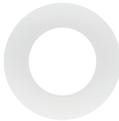
Afdekring PD9 Ø 36 mm Art.nr.: 92238

Spanning: 230 V AC \pm 10\% Afmetingen: 50 x 23 x 8 mm Beschermingsgraad/-klasse: IP20 / Klasse II