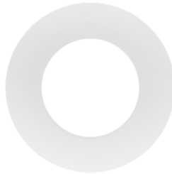
Afdekring PD9 Ø 36 mm Art.nr.: 92238

Spanning: 230 V AC ±10% Afmetingen: 50 x 23 x 8 mm Beschermingsgraad/-klasse: IP20 / Klasse II