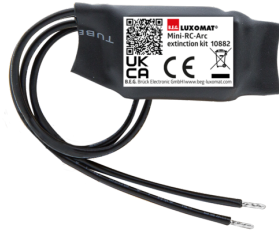
Mini-Overspanningsbegrenzer Art.nr.: 10882

Spanning: 230 V AC ±10% Afmetingen: 50 x 23 x 8 mm Beschermingsgraad/-klasse: IP20 / Klasse II