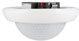
PD4N-KNXs-DX-VZ Art.nr.: 93517

Om de bundel volgens de technische specificatie te ontvangen, bestelt u de genoemde items.