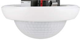
PD4N-KNXs-DX-VZ Art.nr.: 93517

Om de bundel volgens de technische specificatie te ontvangen, bestelt u de genoemde items.