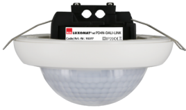
PD4N-DALI-LINK Art.nr.: 93377

Om de bundel volgens de technische specificatie te ontvangen, bestelt u de genoemde items.