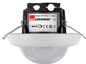
PD4N-CAS DALI-2 Art.nr.: 93473

Om de bundel volgens de technische specificatie te ontvangen, bestelt u de genoemde items.