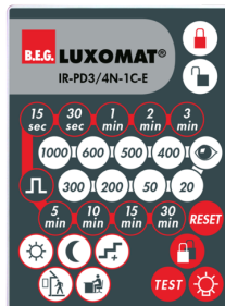
IR-PD3/4N-1C-E Art.nr.: 93110

Batterij: 3.0 V Lithium CR2032 (inclusief) Afmetingen: 80 x 60 x 8 mm Kleur: -