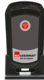
BLE-IR-Adapter Art.nr.: 93067

Spanning: 230 V AC \pm 10\% Afmetingen: 50 x 23 x 8 mm Beschermingsgraad/-klasse: IP20 / Klasse II