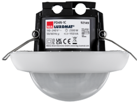
PD4N-1C-IB Art.nr.: 92149

Om de bundel volgens de technische specificatie te ontvangen, bestelt u de genoemde items.