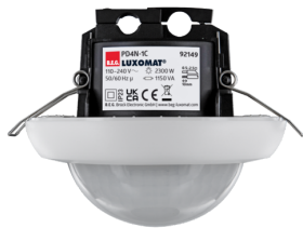
PD4N-1C-IB Art.nr.: 92149

Om de bundel volgens de technische specificatie te ontvangen, bestelt u de genoemde items.