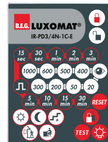
IR-PD3/4N-1C-E Art.nr.: 93110

Batterij: 3.0 V Lithium CR2032 (inclusief) Afmetingen: 80 x 60 x 8 mm Kleur: -