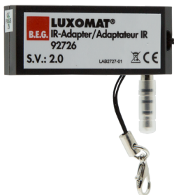
IR adapter voor Smartphones Art.nr.: 92726

Afmetingen: 40 x 55 x 103 mm Kleur: zwart Frequentie: 2.4 GHz ISM band, GFSK 0.2 dBm + 5.3 dBi = 5.5 dBm