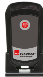
BLE-IR-Adapter Art.nr.: 93067

Spanning: 230 V AC \pm 10\% Afmetingen: 50 x 23 x 8 mm Beschermsgraad/-klasse: IP20 / Klasse II