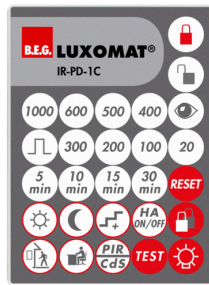
IR-PD-1C Art.nr.: 92520

Afmetingen: 40 x 55 x 103 mm Kleur: zwart Frequentie: 2.4 GHz ISM band, GFSK 0.2 dBm + 5.3 dBi = 5.5 dBm