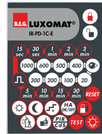
IR-PD-1C-E Art.nr.: 92077

Batterij: 3.0 V Lithium CR2032 (inclusief) Afmetingen: 57 x 35 x 7 mm Kleur: -