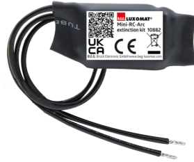
Mini-Overspanningsbegrenzer Art.nr.: 10882

Spanning: 230 V AC \pm 10\% Afmetingen: 38 x 12 x 26 mm Beschermingsgraad/-klasse: IP20 / Klasse II