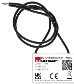
Overspanningsbegrenzer Art.nr.: 10880

Spanning: 230 V AC \pm 10\% Afmetingen: 38 x 12 x 26 mm Beschermingsgraad/-klasse: IP20 / Klasse II