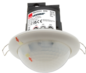
PD4-M-2C-C-IB Art.nr.: 92143

Om de bundel volgens de technische specificatie te ontvangen, bestelt u de genoemde items.