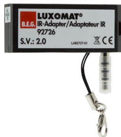
IR adapter voor Smartphones Art.nr.: 92726

Batterij: 3 x 1.5 V Micro AAA (niet inclusief) Afmeting: 83 x 53 x 17 mm Kleur: -