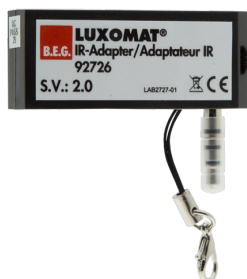
IR adapter voor Smartphones Art.nr.: 92726

Batterij: 3 x 1.5 V Micro AAA (niet inclusief) Afmeting: 83 x 53 x 17 mm Kleur: -