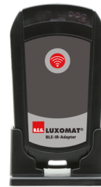
BLE-IR-Adapter Art.nr.: 93067

Spanning: 230 V AC \pm 10\% Afmetingen: 50 x 23 x 8 mm Beschermsgraad/-klasse: IP20 / Klasse II