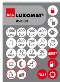
IR-PD3N Art.nr.: 92105

Batterij: 3.0 V Lithium CR2032 (inclusief) Afmetingen: 80 x 60 x 8 mm Kleur: -