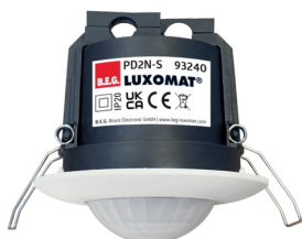
PD2N-S Art.nr.: 93240

Om de bundel volgens de technische specificatie te ontvangen, bestelt u de genoemde items.