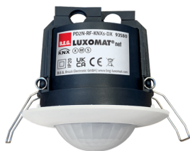
PD2N-RF-KNXs-DX-IB Art.nr.: 93580

Om de bundel volgens de technische specificatie te ontvangen, bestelt u de genoemde items.