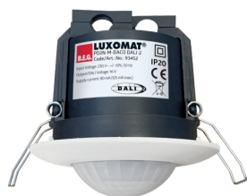
PD2N-M-DACO DALI-2 Art.nr.: 93452

Om de bundel volgens de technische specificatie te ontvangen, bestelt u de genoemde items.