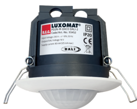
PD2N-M-DACO DALI-2 Art.nr.: 93452

Om de bundel volgens de technische specificatie te ontvangen, bestelt u de genoemde items.