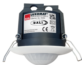
PD2N-M-DACO-1C DALI-2 Art.nr.: 93455

Om de bundel volgens de technische specificatie te ontvangen, bestelt u de genoemde items.