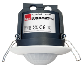
PD2N-CAS Art.nr.: 93477

Om de bundel volgens de technische specificatie te ontvangen, bestelt u de genoemde items.