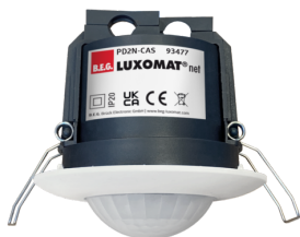
PD2N-CAS Art.nr.: 93477

Om de bundel volgens de technische specificatie te ontvangen, bestelt u de genoemde items.