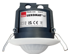
PD2N-CAS Art.nr.: 93477

Om de bundel volgens de technische specificatie te ontvangen, bestelt u de genoemde items.