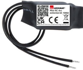
Mini-Overspanningsbegrenzer Art.nr.: 10882

Spanning: 230 V AC ±10% Afmetingen: 38 x 12 x 26 mm Beschermingsgraad/-klasse: IP20 / Klasse II