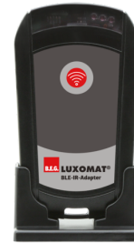
BLE-IR-Adapter Art.nr.: 93067

Spanning: 230 V AC \pm 10\% Afmetingen: 50 x 23 x 8 mm Beschermingsgraad/-klasse: IP20 / Klasse II