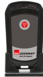
BLE-IR-Adapter Art.nr.: 93067

Spanning: 230 V AC ±10% Afmetingen: 50 x 23 x 8 mm Beschermsgraad/-klasse: IP20 / Klasse II