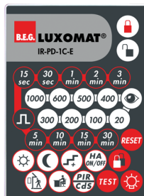
IR-PD-1C-E Art.nr.: 92077

Batterij: 3.0 V Lithium CR2032 (inclusief) Afmetingen: 80 x 60 x 8 mm Kleur: -