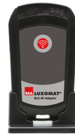
BLE-IR-Adapter Art.nr.: 93067

Spanning: 230 V AC \pm 10\% Afmetingen: 50 x 23 x 8 mm Beschermsgraad/-klasse: IP20 / Klasse II