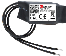
Mini-Overspanningsbegrenzer Art.nr.: 10882

Spanning: 230 V AC \pm 10\% Afmetingen: 38 x 12 x 26 mm Beschermsgraad/-klasse: IP20 / Klasse II