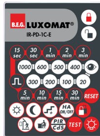
IR-PD-1C-E Art.nr.: 92077

Batterij: 3.0 V Lithium CR2032 (inclusief) Afmetingen: 80 x 60 x 8 mm Kleur: -