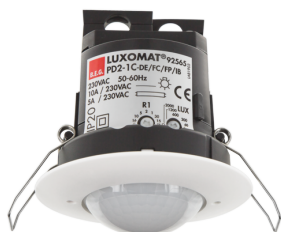
PD2-M-1C-IB Art.nr.: 92565

Om de bundel volgens de technische specificatie te ontvangen, bestelt u de genoemde items.