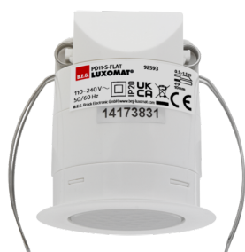
PD11-S-FLAT-IB Art.nr.: 92593

Om de bundel volgens de technische specificatie te ontvangen, bestelt u de genoemde items.