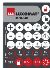
IR-PD-DALI Art.nr.: 92094

Afmetingen: 47 x 19 x 10 mm Beschermingsgraad/-klasse: IP20 Omgevingstemperatuur: -20 °C tot +40 °C