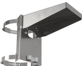
paalbevestiging met bescherming tegen weersinvloeden Art.nr.: 93220

Afmetingen: Ø 164 x 143 mm Slagvastheid: IK09 Behuizing: gecoate stalen korf