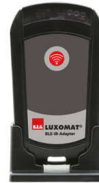
BLE-IR-Adapter Art.nr.: 93067

Spanning: 230 V AC \pm 10\% Afmetingen: 50 x 23 x 8 mm Beschermingsgraad/-klasse: IP20 / Klasse II