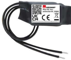
Mini-Overspanningsbegrenzer Art.nr.: 10882

Spanning: 230 V AC \pm 10\% Afmetingen: 38 x 12 x 26 mm Beschermingsgraad/-klasse: IP20 / Klasse II