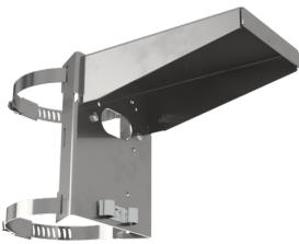
paalbevestiging met bescherming tegen weersinvloeden Art.nr.: 93220

Afmetingen: Ø 164 x 143 mm Slagvastheid: IK09 Behuizing: gecoate stalen korf