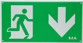
Pictogram DT32-LED pijl naar onder Art.nr.: 8785

Afmetingen: 170 x 330 x 1 mm Behuizing: Kunststof Kleur: groen