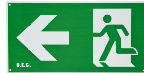
Pictogram DT32-LED pijl naar links Art.nr.: 8859

Afmetingen: 170 x 330 x 1 mm Behuizing: Kunststof Kleur: groen