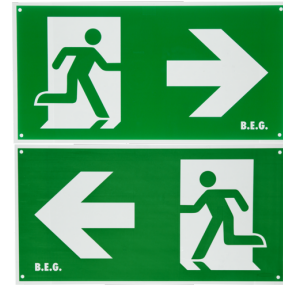
Pictogram twee zijden link en rechts

Afmetingen: 47 x 19 x 10 mm Beschermingsgraad/-klasse: IP20 Omgevingstemperatuur: -20 °C tot +40 °C