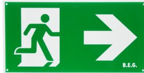
Pictogram DT32-LED pijl naar rechts Art.nr.: 8858

Afmetingen: 170 x 330 x 1 mm Behuizing: Kunststof Kleur: groen