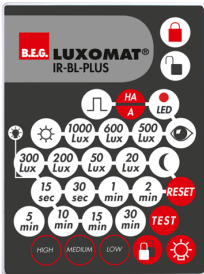
IR-BL-PLUS Art.nr.: 93406

Afmetingen: 40 x 55 x 103 mm Kleur: zwart Frequentie: 2.4 GHz ISM band, GFSK 0.2 dBm + 5.3 dBi = 5.5 dBm