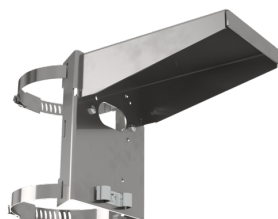
paalbevestiging met bescherming tegen weersinvloeden Art.nr.: 93220

Afmetingen: Ø 71 x 34 mm Beschermingsgraad/-klasse: IP54 Behuizing: polycarbonaat, UV-bestendig