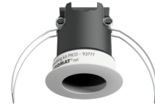
Montage set PICO Art.nr.: 93777

Afmetingen: Ø 45 x 50 mm Beschermsgraad/-klasse: IP20 Behuizing: polycarbonaat, UV- bestendig