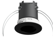
Montage set PICO Art.nr.: 93778

Afmetingen: Ø 45 x 50 mm Beschermsgraad/-klasse: IP20 Behuizing: polycarbonaat, UV-bestendig