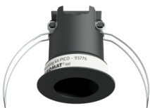
Montage set PICO Art.nr.: 93776

Afmetingen: Ø 45 x 50 mm Beschermsgraad/-klasse: IP20 Behuizing: polycarbonaat, UV- bestendig