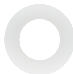
Afdekring PD9 Ø 36 mm Art.nr.: 92238

Afmetingen: Ø 36 mm Behuizing: polycarbonaat, UV- bestendig Kleur: antraciet glanzend